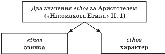
Рис. 1.1. Поняття «етика»

(лікей). Учень Платона. Вихователь Олександра Македонського. Автор учення про метафізику як «першу філософію», науку про «сущє». Започаткував систематизацію філософських категорій (логіка). Створений Аристотелем понятійний апарат визначив теоретичний лексикон усього подальшого філософування. За словами Гегеля, Аристотель уперше зробив філософію науковою. Розробник проблематики «філософії про людське» (етику і політику): людина за своєю природою є політичною, тобто суспільною істотою — «зоон політикон», вище благо людини визначається як «щастя» (евдемонія). Основні твори: «Трактат про першу філософію», «Категорії», «Фізика», «Нікомахова етика», «Політика».