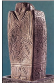
Керносівський ідол. III тис. до н. е.

Визначальним для культурного розвитку праукраїнців був рубіж I тис. до н. е. – I тис. н. е. У цей період творців культури, різних за походжен-