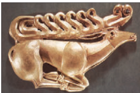
Золоте зображення оленя. VII–VI ст. до н. е.

ням і світоглядом, було чимало, але провідну роль у її розвитку відігравали традиції давнього європейського етносу – східних слов'ян . Густа мережа їхніх поселень розкинулася по