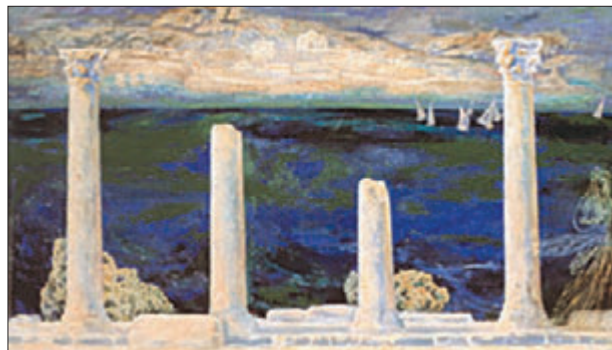
О. Ольхов. Міраж. Херсонес

всій території сучасної України. Упродовж тривалого часу становлення слов'янської самобутньої культури відбувалося за активних зовнішніх впливів.