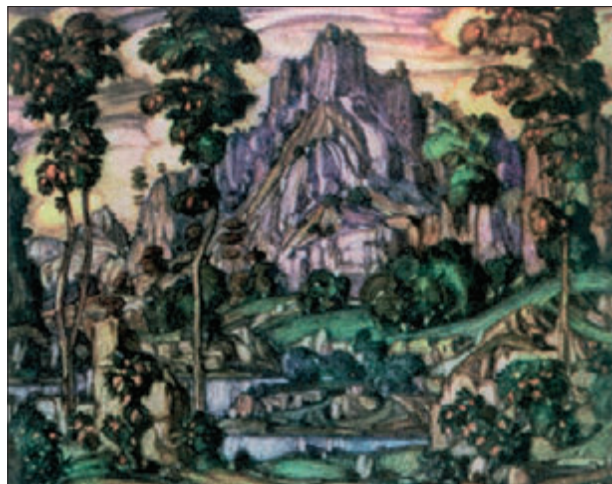
К. Богаєвський. Земля кіммерійська