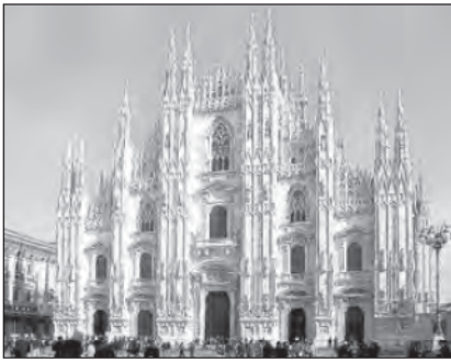
Міланський собор. Італія

Для створення ефекту легкості й спрямованості вгору архітектори оздоблювали споруду вертикальними декоративними деталями. У XV ст. виникають дивовижні за складністю рисунка склепіння, які отримали назву «зірчастих», «сітчастих», «віялоподібних» (капела Королівського коледжу в Кембриджі, капела Генріха II Вестмінстерського собору).